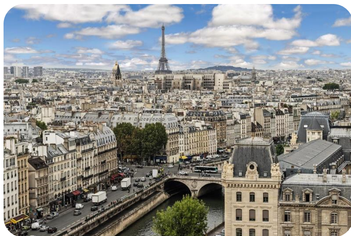
Vue panoramique sur Paris

D'autres sont récents , généralement plus élevés , souvent en béton .