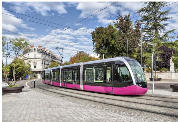
Le tramway à Dijon

Certains citoyens (= habitants des villes ) aiment la vie en centre-ville.